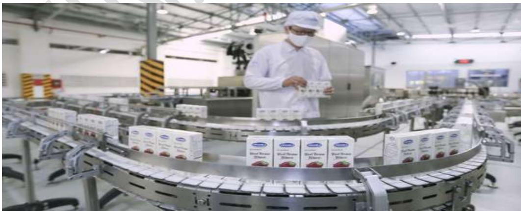
Dây chuyền sản xuất hiện đại tại các nhà máy của Vinamilk

Câu 3. Kiểm tra sản phẩm của một nhà máy, người ta thấy trung bình cứ 100 sản phẩm thì có 95 sản phẩm đạt chuẩn. Hỏi số sản phẩm đạt chuẩn chiếm bao nhiêu phần trăm tổng số sản phẩm của nhà máy?